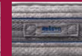
důmyslné boční odvětrání potahu i s praktickým úchopem