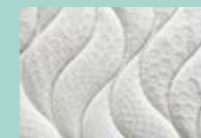
velmi příjemný povrch potahu Silver Safe