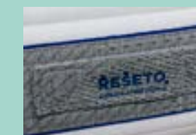
důmyslné boční odvětrání potahu i s praktickým úchopem