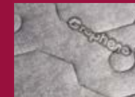
velmi příjemný povrch potahu Graphene